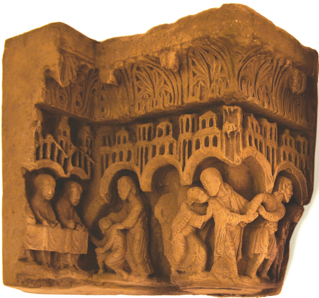
Capiteles de la Catedral de Nuestra Señora de Chartres, Francia Gótico Francés, S. XII

Además de las funciones propias de todo capitel, el románico-gótico fue asimismo un instrumento didáctico de primer orden, pues se le confió la tarea de transmitir a los fieles las enseñanzas evangélicas, las del Antiguo Testamento o las de las vidas de los santos, por medio de representaciones figurativas de escenas apropiadas, denominándose capitel historiado. Estos capiteles representan la entrada de Cristo a Jerusalén y el beso de Judas